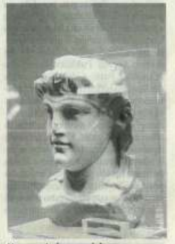
Un reperto in esposizione

●●● Oggi, dalle 9 alle 20 (ultimo ingresso ore 19.30), si potrà visitare il museo del Baglio Anselmi sul lungomare Boeo a Marsala dove sono conservati i materiali che provengono principalmente dalle campagne di scavo condotte dai primi del Novecento ad oggi, insieme ad un ristretto nucleo dalla collezione "G. Whitaker" di Mozia e da vecchie acquisizioni comunali. Dall'ingresso principale si aprono due ampie sale espositive: la prima, a destra, è dedicata all'esposizione dei rinvenimenti subacquei. La sala a sinistra è dedicata a Lilibeo. Biglietti: 4 e 2 euro. (*MAX)